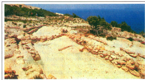
Αθηνών Μελέτιος (1700) ονομάζει Βεγαλίζ παράλληλα με το όνομα

Το σημερινό όνομα της νησίδας είναι γνωστό από τον 16. αι., σύμφωνα με τα μέχρι σήμερα δεδομένα. Στο Χάρτη της Ελλάδος (1575) του J. Gastaldi σημειώνεται ως Hiadi . Επίσης στο Χάρτη του Αιγαίου του J. Seller καταχωρείται ως Yali . Τον ίδιο αιώνα έχουμε τη μαρτυρία του Piri Reis (1520) , ο οποίος ακούει τους άπιστους να λένε το νησί Γυαλί . Αργότερα ο Μητροπολίτης