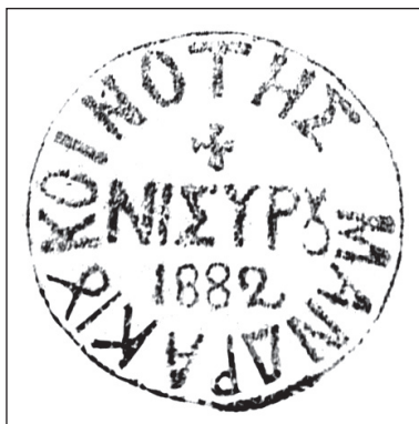
«Κοινότης Μανδρακίου Νισύρου», 1882