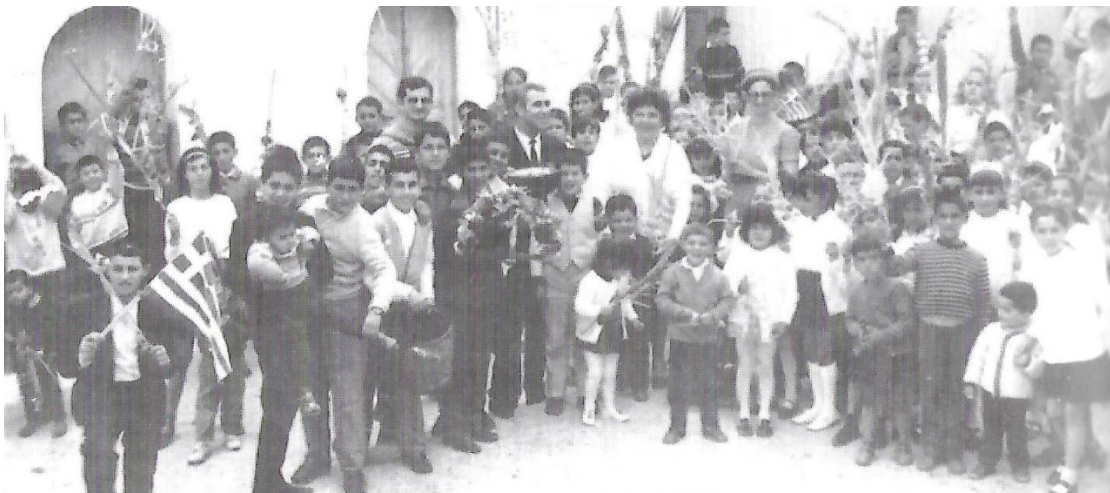
Δάσκαλοι και μαθητές με την καλαντήρα, μπροστά στο δημαρχείο, σε νεώτερους χρόνους