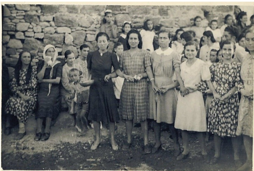
Νο 3. Νισυριές χορεύουν την κούππα, την ίδια χρονιά με την φωτογραφία Νο 2