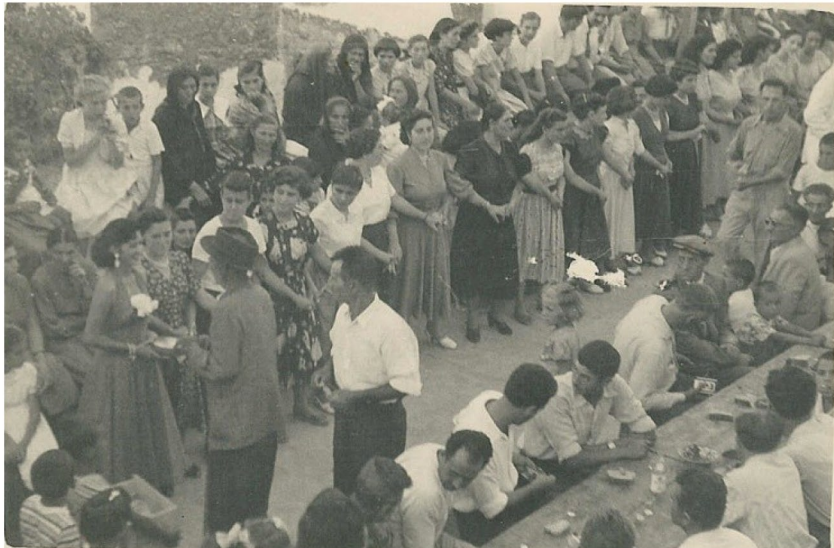
Νο 4. Νισυριά της Αμερικής στο μπροστάρι της «κούπας», μέσα 10ετίας του 50