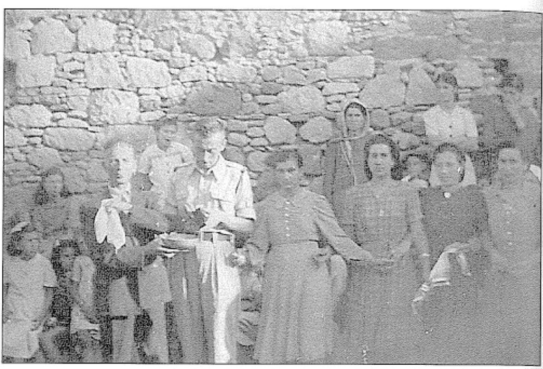
Νο 2. Αρχές 10ετίας του 50. Ο Διοικητής του αστυνομικού τμήματος Νισύρου, οδηγεί στην «κούππα» τον δήμαρχο του νησιού.