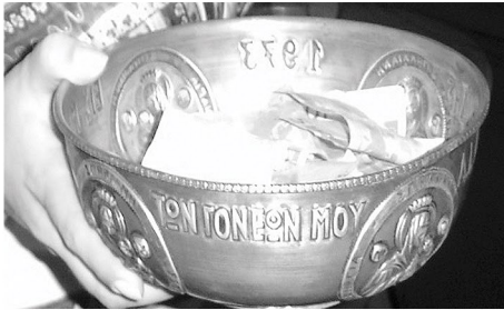
Νο 1. Η «κούππα» στα χέρια Νισυριάς, στη σύγχρονη εποχή