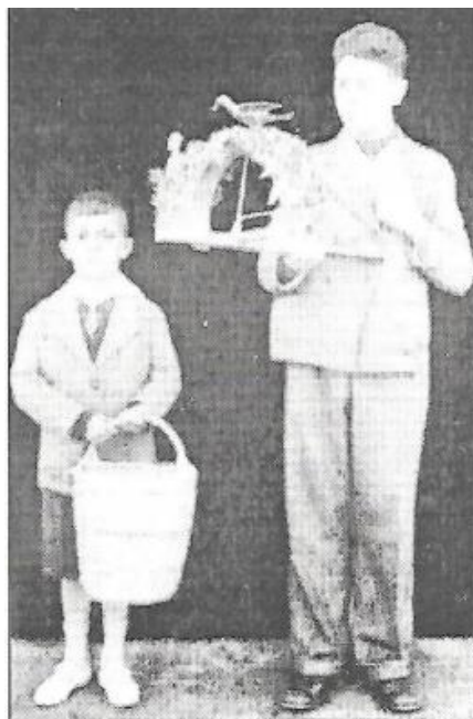
‘Η Καλαντήρα και τ’ Αύγοκάλαθο

12. Τελευταία συμπλήρωση/επικαιροποίηση του Δελτίου. Φωτογραφίες από την διαχρονική πραγματοποίηση του εθίμου: