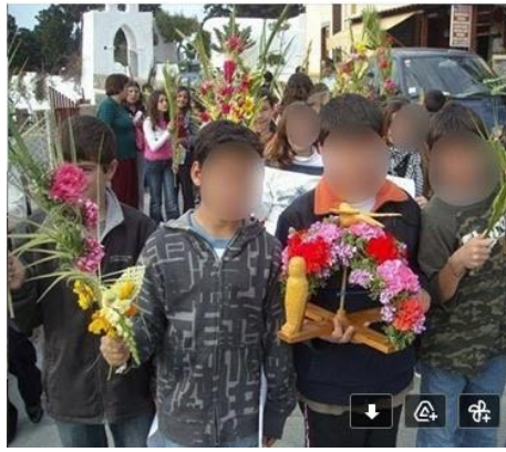
Το «γύρισμα της καλαντήρας» στις μέρες μας.