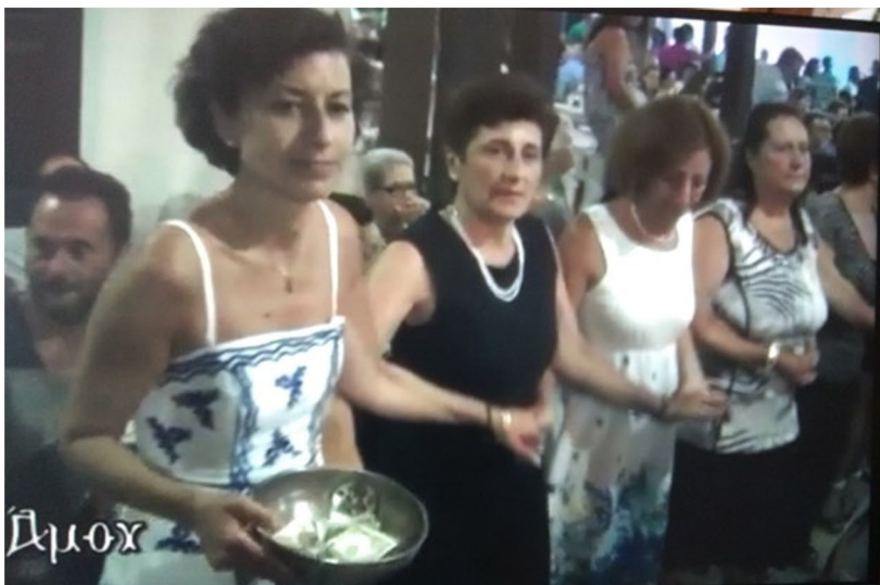
Νο 5. Νισυροπούλα της Αμερικής χορεύει με την κούπα.