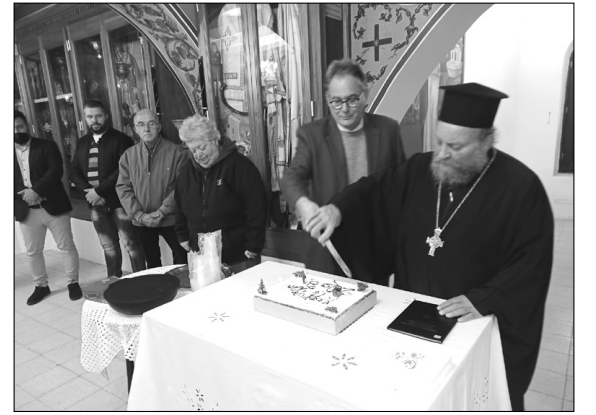
Από την κοπή της Βασιλόπιτας