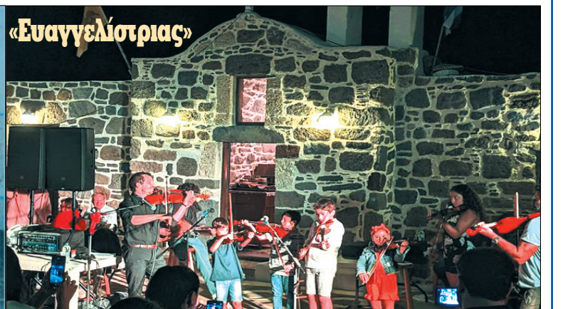
... και τώρα!!

Πότε, επιτέλους θα γίνει κατανοητό, πως η παραδοσιακή αρχιτεκτονική της Νισύρου δεν κινδυνεύει μόνο από το ...αλουμίνιο ;