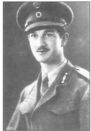
Ο Υπολοχαγός Ευάγγ. Χατζεναγέλου

Ήμασταν τότε παιδιά δεκάχρονα και δωδεκάχρονα κι όταν μάθαμε τα γεγονότα, αμέσως τρέξαμε, ποδαρόδρομο, στους Πάλους. Εκεί υποδεχτήκαμε και χειροκροτήσαμε τους νικητές Ιερολοχιτες, όταν κατά ομάδες κατέβαιναν από τον Εμπορείο, χαρούμενοι για την έκβαση της μάχης, όμως πικραμένοι για την απώλεια ενός ηρωικού Αξιωματικού - συναδέλφου τους. Και μετά συνοδεύσαμε τη σορό του ηρωικού νεκρού Χατζεναγέλου, η οποία, ελλείψει φορείου, μεταφέρθηκε, πάνω σε ξύλινη ανεμόσκαλα, στους ώμους των παλικαριών του νησιού, στο Μανδράκι, όπου έγινε ο ενταφιασμός, ενώ του αποδόθηκαν όλες οι δυνατές επικλήσεις τιμής. Από τότε η Νίσυρος θυμάται και πρέπει εσείς να θυμάται, να τιμά και να ευγνωμονεί ένα νέο παλικάρι, που δεν δίτασε να θυσιάσει τη ζωή του για να κρατήσει το νησί μας ελεύθερο και να χαρίσει στα Ελληνικά όπλα τη νίκη. Κι αυτή η υποχρέωση τιμής, ως αποτέλεσμα παρακαταθήκη για όλες τις μετέπειτα γενιές.