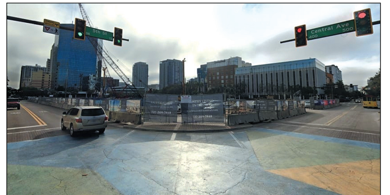
Το οικοπέδο της οικοδομής

Όπως ανεγράφη στον Αθηναϊκό τύπο (prontosnews -epikos.gr), σε ιδιόκτητο οικοπέδο του έκτασης 400 στρεμμάτων στο κέντρο της Φλόριδας, ανεγείρει 46όροφο κτήριο πολυτελών κατοικιών, το οποίο θα είναι το υψηλότερο της περιοχής, με θέα προς τον κόλπο του Μεξικού.