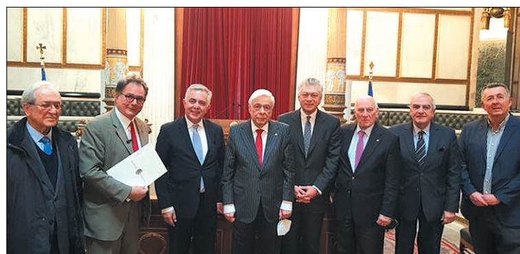
Συμμότυπο από την τελετή της υπογραφής του Μνημονίου