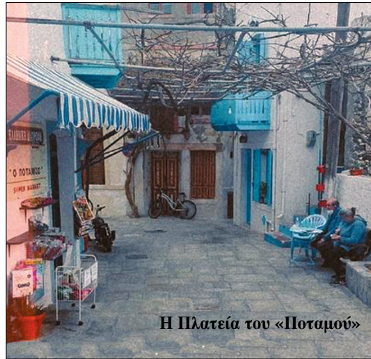
Η Πλατεία του «Ποταμού»

Όσο για τις «... απόμπες», κι αυτές θα βρουν θέση στον παρακείμενο ακάλυπτο χώρο, ώστε να πάψει επιτέλους η αναχρονιστική συνήθεια να ρίχνονται μέσα στο Ναό και να διακόπτουν την ακολουθία. Πολλές φορές έχουμε διατυπώσει την πρόταση και είναι άξιον απορίας γιατί περνά απαρατήρητη, όταν μάλιστα βρίσκει σύμφωνο μεγάλο, μέρος, ίσως και το σύνολο, της τοπικής κοινωνίας. Ενόψει του Πάσχα την επαναφέρουμε, για μια ακόμα φορά, με την προσδοκία, αυτή τη φορά να τύχει θετικότερης υποδοχής.