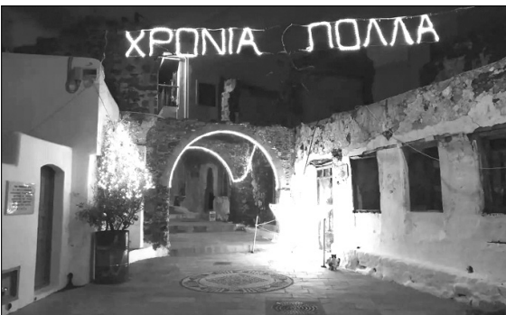
Ο Εμπορείος φωτοαγωγημένος

Ο σεβασμιότατος Μητροπολίτης μας κ. Ναθαναήλ, τηρώντας το καθιερωμένο πρόγραμμά του, τέλεσε τη θεία λειτουργία των Χριστουγέννων στο Ναό του Ποταμίτισσας, την επομένη λειτουργήσε στο Ναό του Γενεσίου της Θεοτόκου στον Εμπορείο, ενώ στην εορτή του Αγίου Στεφάνου χοροστάτησε στη λειτουργία στη Μονή της Σπηλιανής και ευχήθηκε, για την ονομαστική του εορτή, στον εορτάζοντα Ηγούμενο, Αρχιμανδρίτη Στέφανο.