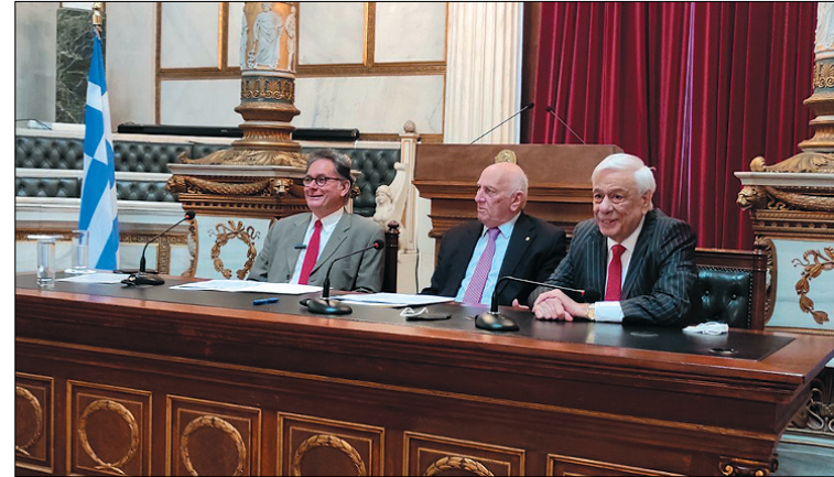
Η υπογραφή του Μνημονίου

Το Μνημόνιο υπέγραψαν εκ μέρους του Δήμου Νισύρου ο Δήμαρχος Χριστοφής Κορωναίος και εκ μέρους της Ακαδημίας ο Γεν. Γραμματέας καθηγητής Χρίστος Ζερεφός, ενώ παρών στην υπογραφή ήταν και ο νέος Ακαδημαϊκός Προκόπης Παυλόπουλος, πρώην Πρόεδρος της Δημοκρατίας και επίτιμος Δημότης Νισύρου.