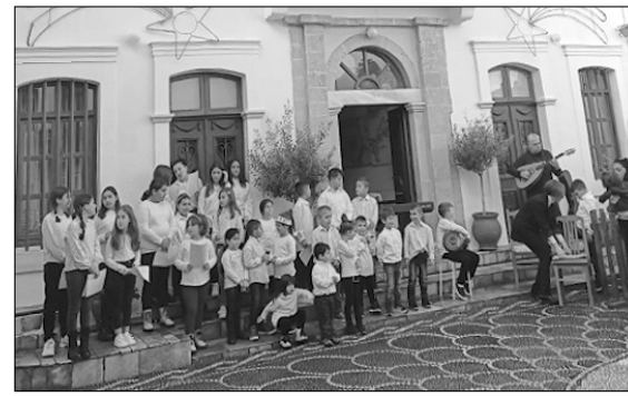
Από την εκδήλωση του Πολιτιστικού Συλλόγου

αλληλεγγύης διένειμε σ' όλους τους κατοίκους του καθιερωμένου «Καλάθι της Αγάπης», με διάφορα είδη τροφίμων, ποτών, γλυκισμάτων κ.α., ενώ για τα παιδιά του νησιού οργάνωσε γιορτή, με πλούσιο γιορταστικό πρόγραμμα, που παρουσίασε παιδικό θιάσος. Εξάλλου ο αποχαιρετισμός του χρόνου, που έφυγε έγινε με καλλιτεχνικό πρόγραμμα, που οργάνωσε, το μεσημέρι της παραμονής, στην πλατεία του Δημαρχείου ο Πολιτιστικός Σύλλογος, με Κάλαντα και Χριστουγεννιάτικα τραγούδια, που απέδωσαν η παιδική χορωδία του Συλλόγου, με συ-