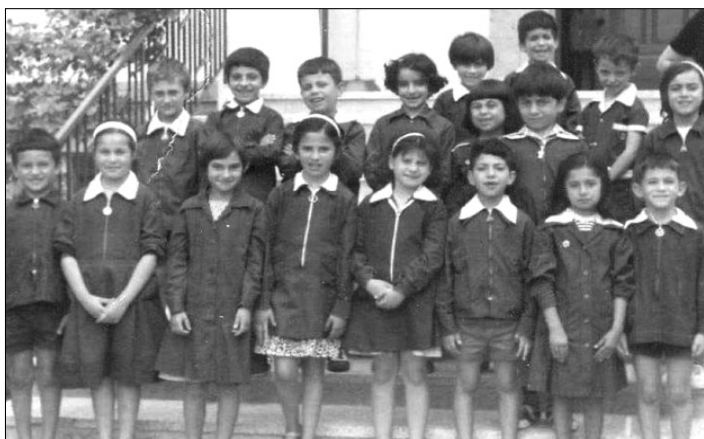
Ούτε μάγκες, ούτε φίμες. Πλούσιοι και φτωχοί το ίδιο...

Όμως στην πορεία φάνηκε πως η απόφαση αυτή είχε αρνητικό αποτέλεσμα, όπως υποστήριξαν και υποστηρίζουν μέχρι σήμερα ειδικοί ψυχολόγοι, αλλά και οι σύλλογοι γονέων. Κάποιοι μάλιστα χαρακτήρισαν την απόφαση ως έγκλημα κατά της νεολαίας, το οποίο συντέλεσε «στο να γεννηθούν κόμπλεξ κατωτερότητας ανάμεσα σε φτωγά παιδιά... τα οποία ήταν υποχρεωμένα να μμηθούν σε ένδειξη τους πιο εύρωστους οικονομικά συμμαθητές τους και να οδηγηθούν σε ένα αγώνα αέναης επίδειξης ανύπαρκτου πλούτου, φορώντας ακριβά ρούχα μέσα στο σχολικό περιβάλλον».