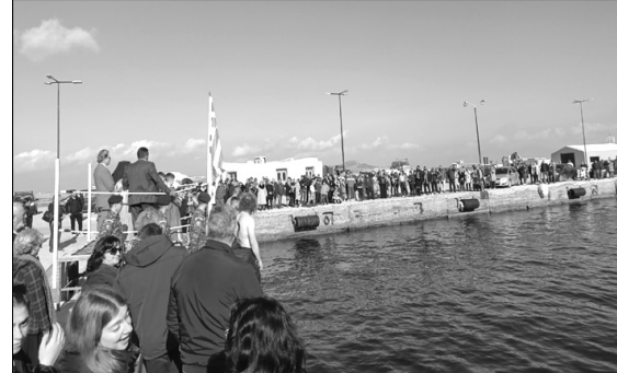
Από την κατάδυση του Σταυρού