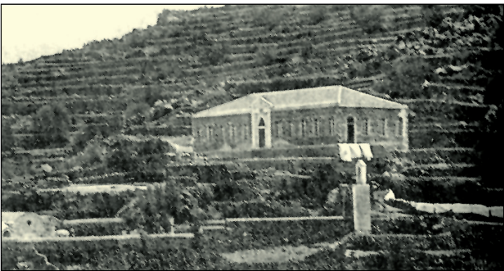
Το Δημοτικό Σχολείο ... άλλοτε

Η κατάσταση όμως ήταν διαφορετική, όταν στην τελευταία τάξη του Γυμνασίου φοιτούσαμε στο Ιπποκράτειο της Κω. Τότε την ημέρα αυτή ο Ουρανός ήταν πιο σκοτεινός και η διάθεση φορτισμένη, αφού θα απομακρυνόμασταν από την οικογενειακή ζεστασιά, θα αποχωριζόμασταν γονείς, αδελφία και φίλους, αλλά και άλλα πρόσωπα, για τα οποία νιώθαμε τότε τα πρώτα ερωτικά φτερουγίσματα. Γι' αυτό και πανηγυρίζαμε όταν από την προηγούμενη και παρά τον αγιασμό των υδάτων, θεόρατα κύματα της Προβέζας κτυπούσαν αλύπητα τα παράλια του νησιού μας, μια κατάσταση, που θα καθιστούσε αδύνατον τον απόπλου του καϊκιού, που την επομένη θα μας μετέφερε στην Καρδάμαινα. Η ίδια ίσως και χειρότερη η κατάσταση την επομένη κι έτσι ήσυχος πήγαμε να ανάψουμε κεράκι στον εορτάζοντα Ναό του Αϊ Γιάννη, στην Ηλικιωμένη. Κι εκεί νιώθαμε ικανοποίηση καθώς ακούσαμε τα παράθυρα να τρίζουν από τον αέρα και σιγουριά για τη μεταίωση του ταξιδιού. Όμως μέσα σ' αυτή τη σιγουριά μας ήρθε το ματτάτο. Ήταν από τον κωπτα-Γιάννη, τον Άπλυτο που μας ειδοποίησε ότι, θα έφευγε σε μια ώρα για Καρδάμαινα και όσοι επρόκειτο να ταξιδέψουν, να μεταβούν το συντομότερο στο λιμάνι.