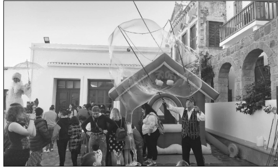
Από την παιδική εκδήλωση

Μ έσα σε κλίμα πανηγυρικό, με πλούσιο γιορταστικό διάκοσμο, συνεργούντος και του καλού καιρού, πέρασαν τις γιορτές του Δωδεκαημέρου των Χριστουγέννων οι συμπατριώτες μας στη Νίσυρο. Όσοι βέβαια παρέμειναν εκεί, γιατί υπήρξαν και εκείνοι, που ακολουθώντας το ρεύμα των τελευταίων χρόνων, επέλεξαν να περάσουν τα Χριστούγεννα στην Πρωτεύουσα ή σε άλλες μεγαλουπόλεις της Χώρας. Οι δρόμοι τόσο στο Μανδράκι όσο και στα άλλα χωριά έλαμπαν από το φωτεινό διάκοσμο, ενώ τα δέντρα στις πλατείες φωτισμένα με πολύχρωμα λαμπρόνια, προσέδιδαν πανηγυρική και εντελώς διαφορετική εικόνα.