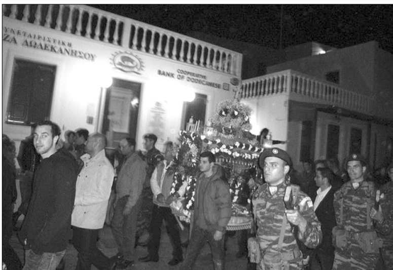
Η περιφορά του Επιταφίου.