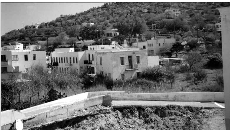
Σε πρώτο πλάνο το σπίτι που αγόρασε ο Δήμος με το οικόπεδο στα δεξιά του.

Στην αγορά του σπιτιού της οικογένειας Σακέλλη και του συνορευομένου οικοπέδου (κάμπου) έκτασης 2,5 στρεμμάτων, στην περιοχή πίσω από το αρχαιολογικό μουσείο, προέβει ο Δήμος.