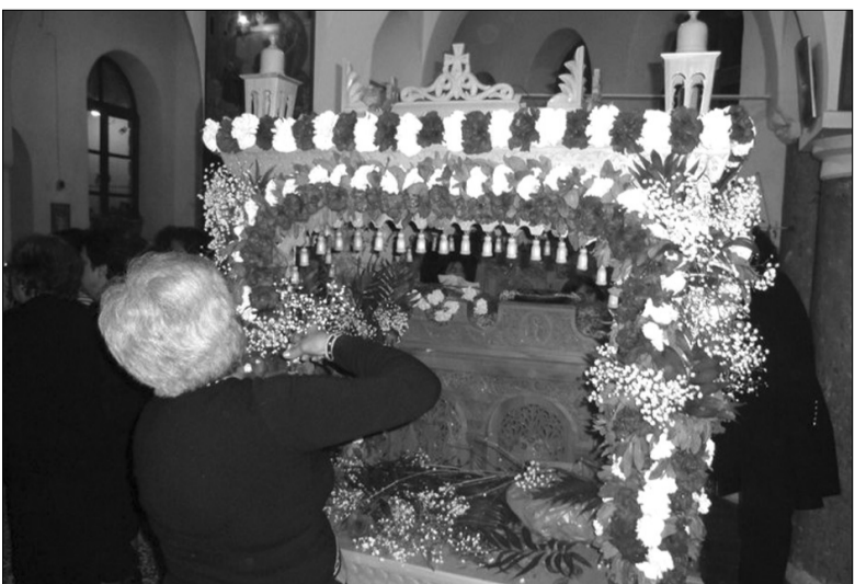
Το στόλισμα του Επιταφίου.