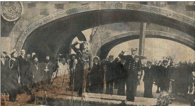
Αριστερά ο Άγγλος Ταξίαρχος Πάρκερ και δεξιά ο Έλληνας Αντιναύαρχος Περικλής Ιωαννίδης κατά την έπαρση της Ελληνικής Σημαίας

Και οι ψυχές των χιλιάδων Δωδεκανησίων αγωνιστών, που έφυγαν από τη ζωή με το όραμα της Λευτεριάς των νησιών μας, έστησαν τότε χορό, για να γιορτάσουν τη δικαίωση των αγώνων και των θυσιών τους, ένεκα των οποίων εφεξής θα ζούσε ελεύθερα τα παιδιά τους και τα εγγόνια τους. Για 638 ολόκληρα χρόνια τα μαρτυρικά Δωδεκάνησα ζούσαν κάτω από το πέλαμα και το βαρύ ζυγό πολυώνυμων κατακτητών, των Ιωαννιτών Ιπποτών επί 213 χρόνια, των Τούρκων επί 390, των Ιταλών επί 31, των Γερμανών επί 2 και επί άλλα τόσα των Αγγλων. Χρόνια διωγμών, στερήσεων, πιέσεων, φυλακίσεων, με στόχο να αλλάξουν το Εθνικό φρόνημα των Δωδεκανησίων, να τους απομακρύνουν από τα ιδανικά της φυλής τους και να τους αποκόψουν από τη θρησκεία των προγόνων τους. Η τελευταία δοκιμασία προήλθε από την Ιταλία, η οποία κατέλαβε τα Δωδεκάνησα την Άνοιξη του 1912. Όμως δεν άργησαν να αποδειχθούν φρούδες οι ελπίδες των Δωδεκανησίων, ότι, τάχα, ως Ευρωπαίοι οι νέοι δυνάστες, θα έδειχναν συμπεριφορά διαφορετική από την ανατολίτικη βαρβαρότητα των προκατόχων τους. Στόχος τους ήταν ο αφελλητισμός των νησιών, ο οποίος έλαβε ευρύτερες διαστάσεις με την επικράτηση του Φασισμού στην Ιταλία. Όμως κάθε καταναγκαστικό μέτρο και κάθε προσπάθεια προσέκρουαν στη σθεναράν αντίσταση των Δωδεκανησίων, ωστόσο ήρθε ο