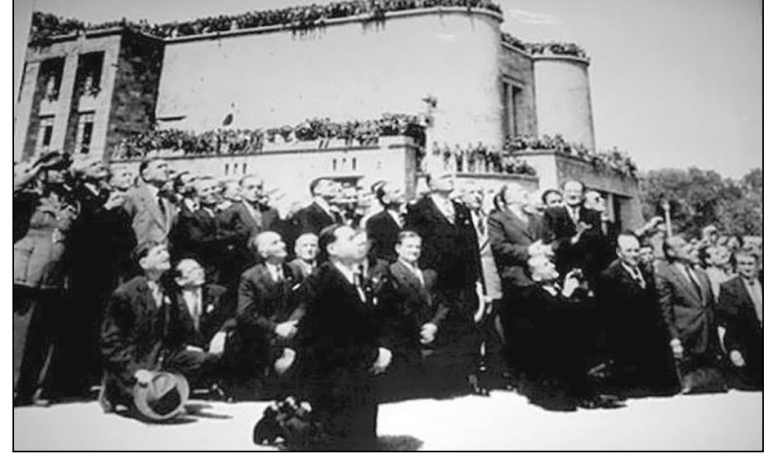
Οι Αρχές της Ρόδου γονυπετεί παρακολουθούν την έπαρση της Ελληνικής Σημαίας

σμος διάβαζε με πηχιαίους τίτλους ότι, «Οι τέσσαρες αποφάσισαν ομόφωνα δια την απόδοση εις την Ελλάδα της Δωδεκανησίου...». Ταυτόχρονα οι καμπάνες των εκκλησιών, με χαρμόσυνες κωδωνοκρουσίες ανήγγελλαν το μήνυμα, που απηχούσε τον προαιώνιο πόθο αναριθμητων γενεών. Μαζί με τις εφημερίδες έπεσε και δέμα από το Δήμο Αθηναίων προς το Δήμο Νισύρου, που περιείχε Ελληνική Σημαία μεγάλην μεγέθους και χαιρετιστήριο μήνυμα του Δημάρχου Αθηναίων, επί τη απελευθέρωσιν των νησιών. Σε πρώτη κίνηση, το γεγονός χαιρετίστηκε με Δοξολογία στην Ποταμίτισσα, που είχε πλημμυρίσει από ένα κόσμο, που ήταν αδύνατο να συγκρατήσει τα