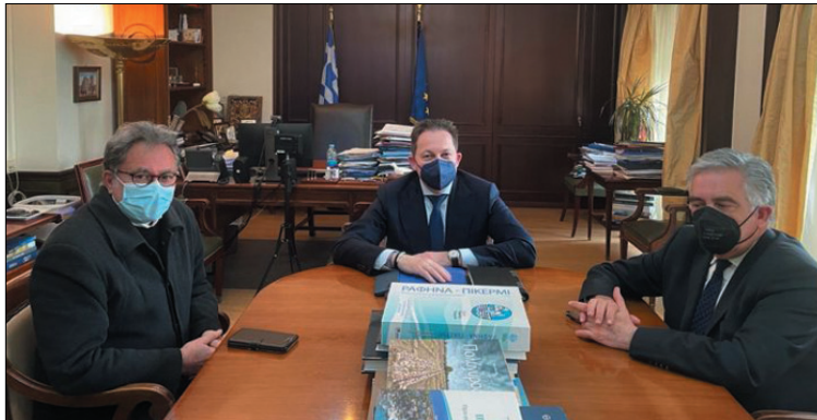
Από τη συνάντηση του Δημάρχου με τον κ. Πέτσα παρουσία και του Βουλευτή Βασ. Υψηλάντη

Με απόφαση του Αναπληρωτή Υπουργού Εσωτερικών Στέλιου Πέτσα και μετά από εισήγηση της αρμόδιας Επιτροπής Αξιολόγησης του Υπουργείου, εντάχθηκε, προς χρηματοδότηση στο πρόγραμμα «Αντώνης Τρίτσης», το έργο «Αντικατάσταση δικτύων ύδρευσης Μανδρακίου και Πάλων νήσου Νιούριου και αγωγού μεταφοράς νερού έως την αραλάτωση», σύμφωνα με μελέτη, που υπέβαλε ο Δήμος. Το έργο δαπάνης 1,2 εκατ. ευρώ αφορά: