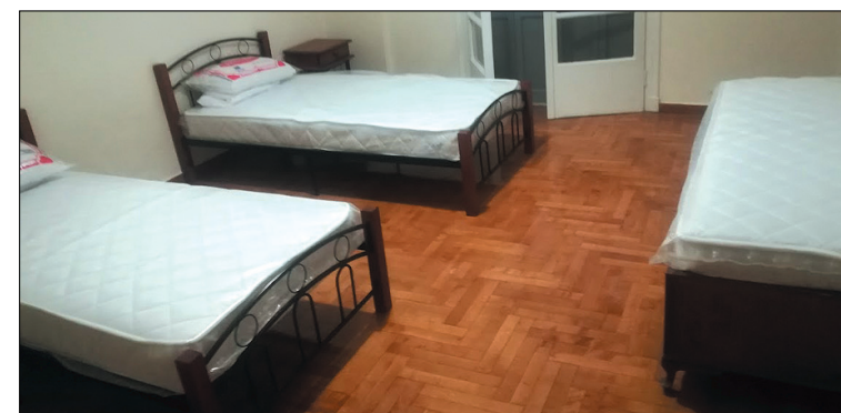
Ένα από τα υπνοδωμάτια του Ξενώνα φιλοξενίας