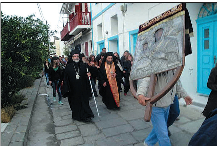
Με την Εικόνα στα χωριά...