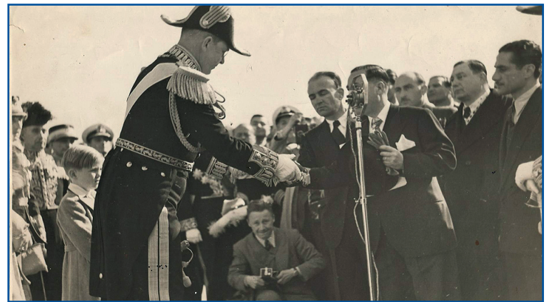
Ο Δήμαρχος Ρόδου παραδίδει το κλειδί της Πόλης στον Βασίλεα Παύλο

Ήταν μια μεγάλη, μια ιερή στιγμή, με το όραμα και την προσδοκία της οποίας, χιλιάδες Δωδεκανησίων έφυγαν από τη ζωή. Ήταν μια Εθνική μυσταγωγία, με την έκταση και τη συναρπαστική γοητεία ενός πραγματοποιούμενου ονειρού. Με την ανάκρουση του Εθνικού Ύμνου, άρχισε να ξετυλίγεται η Γαλανόλευκη στον ελεύθερο πια ουρανό της Δωδεκανησίου. Κι αυθόρμητα τότε, ο λαός της Ρόδου, με επικεφαλής το Δήμαρχο Γαβριήλ Χαρίτο, στο όνομα και των άλλων Δωδεκανησίων αδελφών τους, με εκδηλώσεις, που έκρυβαν την πιο άδολη, την πιο ιερή συγκίνηση, γονάτισαν, σαν ένας άνθρωπος, σταυροκοπήθηκαν και αναλύθηκαν σε δάκρυα.