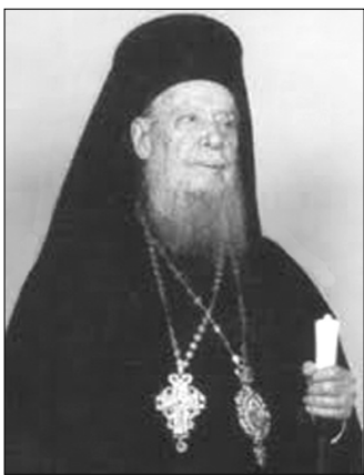
Ο αοιδίμος Μητροπολίτης Ρόδου Σπυρίδιος

Λόγω καλής επίδοσης στο σχολείο, μου είχε χορηγηθεί τότε υποτροφία από το Πανεπιστήμιο Κολούμπια της Ν. Υόρκης κι ενώ ήμουν έτοιμος για αναχώρηση, η Πρεσβεία δεν μου χορήγησε φοιτητική βίβα, με το αιτιολογικό ότι δεν γνώριζα τη γλώσσα, αν και το στοιχείο αυτό είχαν εγγυηθεί το Πανεπιστήμιο να καλύψει με φοίτηση μου σε ειδικό σχολείο ταχείας εκμάθησης. Κι ενώ, μετά από αυτό, προσπαθούσα να χαράξω πορεία για τη ζωή, ήρθε ξαφνικά η καλή είδηση, ως μάννα εξ Ουρανού. Ο τότε ηγούμενος της Μονής της Σπηλιανής Παπαλέξανδρος, με ειδοποίησε πως, ο τότε Μητροπολίτης Ρόδου αοιδίμος Σπυρίδιος, ενέκρινε πρότασή του, να χορηγήσει το ταμείο της Μονής δυο υποτροφίες για φοίτηση ισαριθμίων φοιτητών στη Θεολογική Σχολή του Πανεπιστημίου Αθηνών και ότι η μία εκ των δυο δόθηκε σ' εμένα και η δεύτερη σε έτερον φίλο αγαπητό. Ανεκλάλητη ήταν η χαρά και ανεπίτρεπτος ο ενθουσιασμός, που μου προκάλεσε η είδηση. Όλα γύρω μου άλλαξαν και μια νέα πορεία εχαράσαστο για τη ζωή μου.