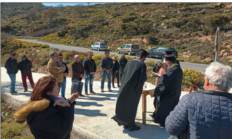
Από τα εγκαίνια του νέου δρόμου

Ένα ακόμα έργο αναγκαίο και υψηλής προτεραιότητας, έλαβε τέλος και με ιδιαίτερη ικανοποίηση πληροφορούμαστε ότι πραγματοποιήθηκαν οι εργασίες διαπλάτυνσης και τσιμεντοστρώσεως του δρόμου, προς το μοναστήρι της Κυράς.