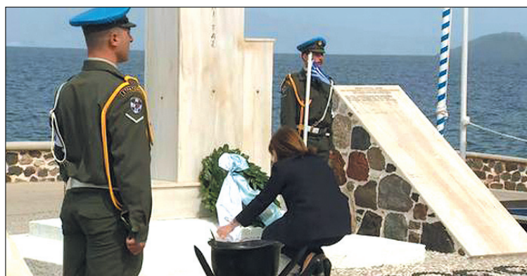
Η Πρόεδρος γονατιστή καταθέτει στεφάνι στο Ηρώο

θος και τη βαθεία θλίψη, που αισθανόμαστε, μετά το τρομερό σιδηροδρομικό δυστύχημα, βρίσκομαι σήμερα στη Νίσυρο για να τιμήσουμε μαζί, όσους αγωνίστηκαν για την ελευθερία της Δωδεκανήσου και την επανένωσή της με τη Μητέρα Πατρίδα, πριν από 75 χρόνια. Ένα από τα φωτεινά ορόσημα της ιστορίας μας, που θα θυμίζει πάντα τη σημασία της εθνικής ευθύνης, ενότητας και ομοψυχίας στην επίτευξη ενός κοινού ανώτερου σκοπού».