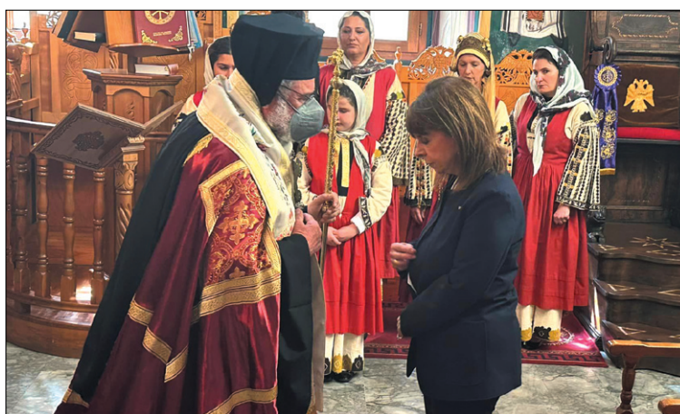
Η Πρόεδρος μετά τη Δοξολογία ασπάζεται τον Τίμο Σταυρό

Υπό τη σκία των τραγικών γεγονότων της κοιλιάδας των Τεμπών, γιορτάστηκε εφέτος ετεροχρονισμένα, την Κυριακή 12 Μαρτίου 2023, η 75η επέτειος της Ενσωμάτωσης των Δωδεκανήσων στην Ελλάδα. Επίκεντρο των εκδηλώσεων, η Ρόδος, ενώ στις εορταστικές εκδηλώσεις στη Νίσυρο παρέστη και τίμησε με την παρουσία της η Πρόεδρος της Δημοκρατίας Κατερίνα Σακελλαροπούλου.