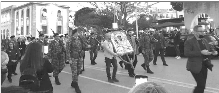
Από την υποδοχή της Εικόνας στη Ρόδο

Όπως μας πληροφορήσαν αναγνώστες της εφημερίδας, «ούτε η Νισυριακή παροικία ενημερώθηκε, ούτε ο Παννισυριακός Σύλλογος «Πορφυρίς» προσκλήθηκε να πλαισιώσει τις εκδηλώσεις, γεγονός, που θεωρήθηκε ως περιφρόνηση και προσβολή προς την πολυπληθή και προβεβλημένη, στην τοπική κοινωνία, παροικία μας. Και επειδή η ίδια και από κάθε άποψη αδικαιολόγητη παράλειψη, σημειώθηκε κατά τη μετάβαση της Εικόνας στην Κρήτη, οπότε παρέμεινε δυο μέρες στον Πειραιά, χωρίς να ενημερωθούν τα μέλη της παροικίας μας της Αθήνας για να προσέλθουν για προσκύνημα, τίθε-