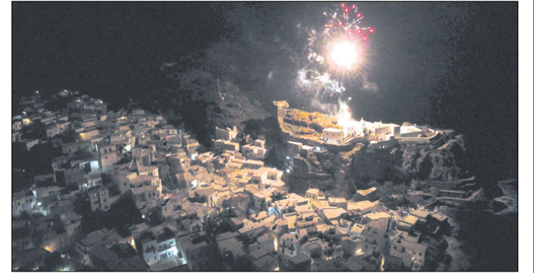
Στιγμιότυπο την ώρα της «Ευχής».

Πριν ακόμα ακουστεί το «Χριστός Ανέστη», αρχίζουν οι ομοβροντίες και συνεχίζονται ακάθεκτες και καταγιγαστικές, με ρίψη ακόμα και μέσα στην Εκκλησία, προκαλώντας δέος και τρόμο, στο εκκλησίασμα, ενώ κάποιες φορές έγιναν απία να διακοπεί η Ακολουθία. Η Νισυρική φύση, με το πλούσιο άρωμά της και το λουλουδιασμένο πολύχρωμο τοπίο της, ομορφαίνει τη λαμπριάτικη ατμόσφαιρα και χαρίζει εικόνες ανεπανάληπτης ζωγραφιάς, καθώς υποδέχεται τους προσκυνητές, που συνοδεύουν την Εικόνα στο πανηγύρι της Ευαγγελίστριας και κατά την επίσκεψή της στους ορεινούς οικισμούς. Και το αποκορύφωμα των εκδηλώσεων είναι την Παρασκευή του Πάσχα, όταν η Εικόνα της Παναγίας επισκέπτεται πόρτα - πόρτα κι ευλογεί με τη Χάρη Της όλα τα σπίτια του νησιού και όταν αργά το βράδυ τελειώσει η περιφορά, η Εικόνα επιστρέφει στο θρόνο της. Όμως στο τέλος της σκάλας, πριν φτάσει στο Μοναστήρι, γίνεται στάση και ψάλλεται «η Ευχή», με όλο τον κόσμο του νησιού, να παρακολουθεί από τις ταραύσες, τα μπαλκόνια και τα παράθυρα των σπιτιών, με τις ευχές και τις δεξιές προς την Παναγία, να τις σκεπάζει ο ήχος από τις βόμβες, που ρίχνονται με καταγιστικό ρυθμό και δημιουργούν ατμόσφαιρα πολέμου.