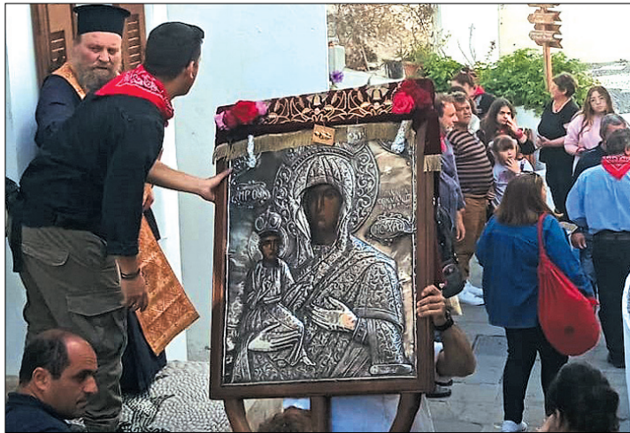
Η Εικόνα της Παναγίας επισκέπτεται και ευλογεί τα σπίτια του νησιού.

Υδανικό, από κάθε άποψη, Πάσχα έζησαν, όσοι προτίμησαν να περάσουν στη Νίσυρο τις Άγιες Ημέρες της Αναστάσεως. Και είναι πολλοί κάθε χρόνο, δικοί μας και ξένοι, που καταφθάνουν αυτές τις μέρες στο νησί, με την πιο ευχάριστη νότα να δίνουν τα Νισυρικά νιάτα, η σπουδάζουσα νεολαία, η οποία επωφελεείται από τις διακοπές, για να ξαναγυρίσει στη ζεστή οικογενειακή φωλιά.