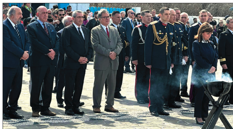
Η Πρόεδρος της Δημοκρατίας παρακολουθεί δέηση υπερ των πεσόντων

Σε δηλώσεις, που προέβη φτάνοντας στο νησί, ανέφερε: «Μέσα στο πέν-