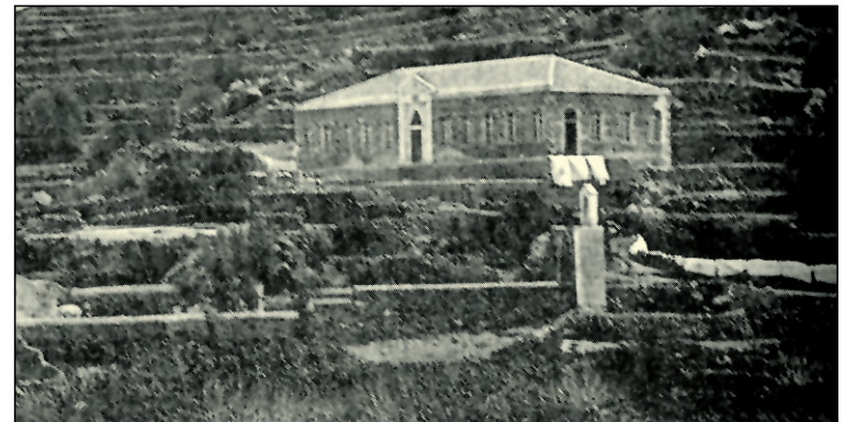
Το Δημοτικό Σχολείο ... άλλοτε

Μεταξύ των έργων, που περιλαμβάνονται στο τεχνικό πρόγραμμα του Δήμου, είναι και η επανατοποθέτηση της κεραμοσκεπής στην Ομήρειο Δημοτική Σχολή, στην οποία στεγάζεται το μοναδικό σήμερα Δημοτικό σχολείο Νισύρου. Κι έτσι το ιστορικό αυτό κτήριο ξαναβρίσκει την παλιά του μορφή και επανακάθεται στην εικόνα, με την οποία το θυμούνται οι χιλιάδες των Νισυρίων, που έχουν συνδέσει στενά τα μαθητικά τους χρόνια με αυτό το κτήριο.