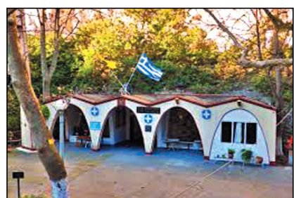
Το εκκλησάκι της Αγ. Παρασκευής

Νέα παιδιά στην πλειονότητά τους, δέχτηκαν σκληρό και αποτρόπαιο το χτύπημά του θανάτου, το οποίο τους έκοψε το νήμα της ζωής την ώρα που άνοιξαν φτερά για να πετάξουν προς το μέλλον. Θλιβερός ο απολογισμός των θυμάτων, που έβαψαν με το αίμα τους την ασφάλτο. Στα 1999, 7 νέα παιδιά οπαδοί του ΠΑΟΚ επιστρέφοντας από αγώνα της ομάδας τους. Το 2003, 49 μαθητές από την Ημαθία, που επέστρεφαν από σχολική εκδρομή στην Αθήνα. Και το 2023, 57 άτομα, οι περισσότεροι φοιτητές, που επέστρεφαν στο σχολείο τους, από τις τριήμερες αποκριάτικες διακοπές, όταν η αμαξοστοιχία στην οποίαν επέβαιναν συγκρούστηκε με άλλη, που εκινείτο αντίθετα, στην ίδια γραμμή. Κι αυτά είναι μόνο τα ατυχήματα, με τα οποία ασχολήθηκε ο τύπος και είδαν το φως της δημοσιότητας.