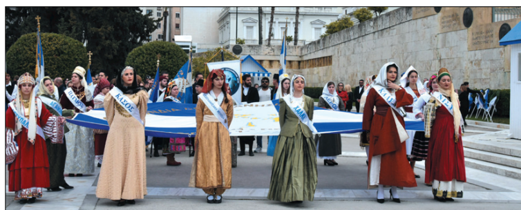
Από την παράταξη στο Μνημείο του Αγνωστού Στρατιώτη

Ξεροχρονισμένα όμως με την καθιερωμένη λαμπρότητα γιόρτασαν οι Δωδεκανήσιοι της Αθήνας την επέτειο της Ενσωμάτωσης των Δωδεκανήσιων στην Ελλάδα. Σύμφωνα με το πρόγραμμα, που συνέταξε η Ομοσπονδία των Δωδεκανησιακών Σωματείων, το Σάββατο 18 Μαρτίου τελέστηκε πανηγυρική Δοξολογία στον Ιερό Ναό του Αγίου Γεωργίου Καρύστου, στην οποία χοροστάτησε ως εκπρόσωπος του Οικουμενικού Πατριάρχου, ο Μητροπολίτης Λέρου, Καλύμνου και Αστυπαλαίας κ. Παΐσιος.