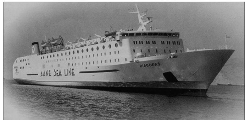
Ο «ΔΙΑΓΟΡΑΣ» της ΔΑΝΕ. Το πλοίο-ζοήμμα που εξυπηρετεί ανελλιπώς τη γραμμή της Νισύρου.

σια της προσπάθειας για ενθάρρυνση και ενίσχυση των κατοίκων των μικρών νησιών, όπως είναι τα αναφερόμενα στην απόφαση νησιά της Δωδεκανήσου