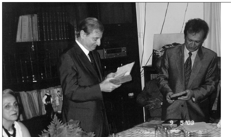
Ο Πρόεδρος της Ε.Ν.Μ. Κ. Χαρτοφύλης προσφέρει στον τιμωμένο τα αναμνηστικά των Συλλόγων

ρωνίδα στον πίνακα των επιτυχημένων παιδιών του. Αλλά και όλη η Νίσυρος νιώθει περήφανη και πιο μεγάλη, καθώς ένα ακόμα θαρύνημο και χρυσοποίκιλο πετράδι προστέθηκε με τα δικά του τα χέρια στο φωτοστέφανο τιμής και δόξας, το οποίο της έχουν φορέσει τα αξία και διακεκρι-