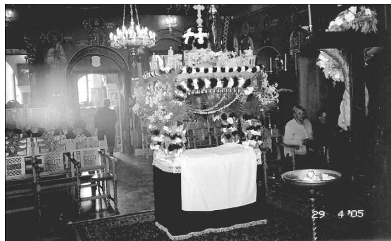
Ο Επιτάφιος της Ποταμιτίσας

Ήταν πολλοί κι εφέτος οι επισκέπτες του νησιού. Κι όλοι τους είχαν την ευκαιρία να γνωρίσουν τα έθιμα και τις παραδόσεις του, με την ιδιαίτερότητα και το τοπικό χρώμα που προσδίδουν στις άγιες αυτές μέρες. Αλλά και να ζήσουν από κοντά την αναπαράσταση του Θεϊού Δράματος, μέσα στις γεμάτες από κόσμο εκκλησίες και σε μια ατμόσφαιρα κατάνυξης και μυσταγωγίας. Να βρεθούν κοντά στις Νισυριές, που ξεχύτησαν εμπρός στον Εσταυρωμένο το βράδυ των Παθών, ψάλλοντας το τοπικό μοιρολόι της Παναγίας. Να παρακολουθήσουν τις κοπέλλες του νησιού που με πολύ γούστο και μεράκι στόλιζαν τον Επιτάφιο. Να ψάλλουν με όλο το εκκλησίασμα τα Εγκώμια κι ύστερα ν' ακολουθήσουν την περιφορά του Επι-