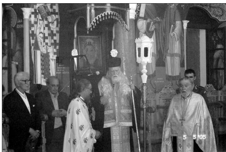
Ο Σεβασμιώτατος Μητροπολίτης κ. Αιμιλιανός χοροστάτησε στον Εσπερινό.

Κατά την αποβίβαση αποδόθηκαν τιμές από στρατιωτικό άγημα και στη συνέχεια σχηματίστηκε πομπή με προπορευόμενο το Άγιο