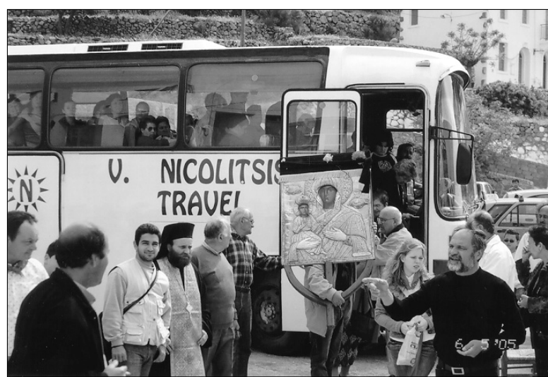
Η εικόνα της Σπηλιανής στα χωριά

Όμως και η Παρασκευή της Λαμπρής εξακολουθεί να είναι μια μεγάλη ημέρα για τη Νίσυρο, που την περιμένει όλο το νησί και ζουν με ανάμνησή της όλοι οι ξενιτεμένοι του. Είναι η ημέρα που η Εικόνα της Σπη-