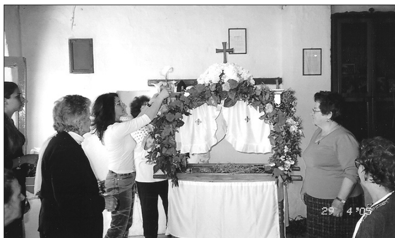
Το στόλισμα του Επιταφίου στο ναό των Εισοδίων στα Νικιά.

Πολεμική ήταν η ατμόσφαιρα και συνεχίστηκε ως το βράδυ, για να φτάσει στο απόγειό της κατά την τελετή της Ανάστασης, στην οποία κι εφέτος πολλοί απέφυγαν από φόβο να προσέλθουν.