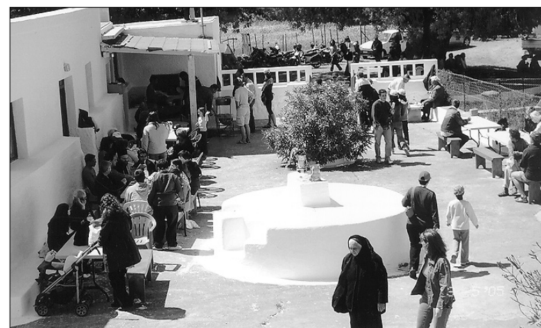
Στο πανηγύρι της Ευαγγελίστριας.

Στενά συνδεδεμένο με τις γιορτές του Πάσχα είναι και το πανηγύρι στην Ευαγγελίστρια, την Τρίτη της Λαμπρής. Κι ήταν κι εφέτος όλοι εκεί, αφού