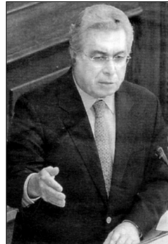
Ο κ. Αριστ. Παυλίδης

Προς τα μικρά ακριτικά νησιά αποφάσισε να στρέψει τον προβολέα της φροντίδας και του ενδιαφέροντός της η Κυβέρνηση. Σύμφωνα με πληροφορίες που είδαν το φως της δημοσιότητας, σε πρόσφατη συνάντηση του Πρωθυπουργού Κων. Καραμανλή με τον Υπουργό Αιγαίου Αριστ. Παυλίδη, αποφασίστηκε όπως σε 44 μικρά και ακριτικά νησιά του Αιγαίου και Ιονίου Πελάγους, εκτελεστούν αναπτυξιακά έργα ύψους δαπάνης 120 εκατ. ευρώ, τα οποία θα συμβάλουν στη βελτίωση της ποιότητας ζωής των κατοίκων και στην καλύτερη εξυπηρέτηση της νησιωτικής χώρας.