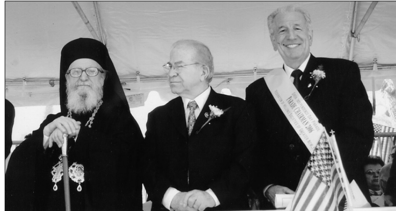
Ο Αρχιεπίσκοπος Αμερικής Δημήτριος με τον Πρόεδρο της Ελληνικής Ομοσπονδίας και το Ντίνο Ράλλη στην εξέδρα των επισήμων.

ομάδες από 120 περίπου σχολεία και σωματεία. Ήταν η ημέρα που κάθε χόνο αισθανόμαστε μεγάλη χαρά και περηφάνεια για την ελληνική καταγωγή μας.