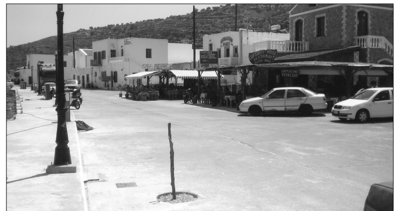
Τα ταβερνάκια στη νέα τους θέση, πάντα γραφικά και πλούσια σε...μεξεδάκια

Όμως υπάρχει και η άλλη άποψη. Χάλασε, λένε, η παραλία, φύγαν τα δένδρα και απομακρύνθηκαν τα γραφικά ταβερνάκια που τη στόλιζαν. Ολοένα καταστρέφεται και η αμμουδιά που ήταν μοναδική στο νησί, αφού τα νέα λιμενικά έργα εμποδίζουν τη συσσώρευση άμμου και δημιουργούν βαθύ με κακοτρόχαλο χαλίκι και πέτρες που διώχνει αντί να προσελκύει τους λουομένους. Και το σοβαρότερο απ' όλα είναι ότι όπως λένε γέμισε το λιμάνι από τα λύματα που αδειάζουν κρυφά κάποια σκάφη, με αισθητή τη δυσσομία σ' όλη την παραλία. Μίπως όμως κάπου υπάρχει υπερβολή; Μίπως είναι νωρίς για να βγουν συμπεράσματα; Μίπως στην πορεία του χρόνου δημιουργηθούν προϋποθέσεις ευνοϊκές και για τις δύο πλευρές; Ας περιμένουμε λοιπόν και τα ξαναλέμε.