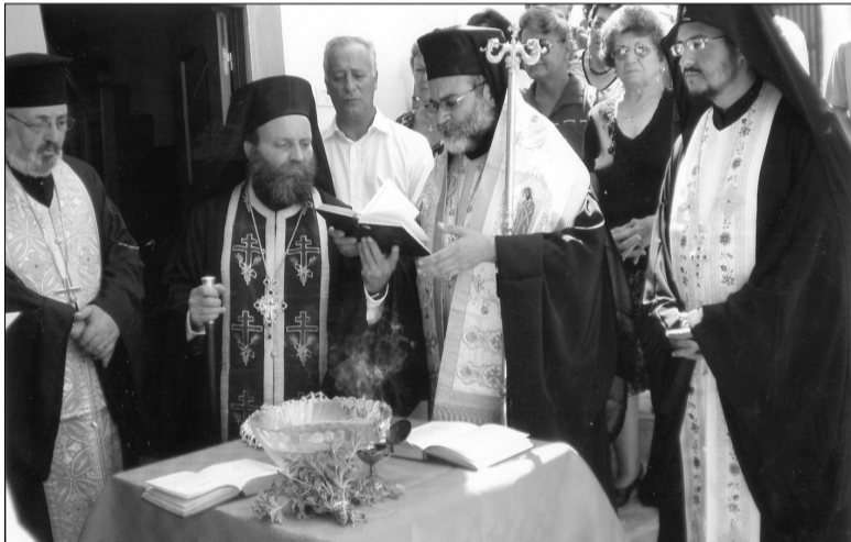
Από τον Αγιασμό των εγκαίνιων.

Τα εγκαίνια του Επισκοπείου έγιναν από τον ίδιο τον Μητροπολίτη κ. Ναθαναήλ, παρουσία των τοπικών Αρχών με επικεφαλής το Δήμαρχο, του κλήρου του νησιού και πλήθους κόσμου. Μετά τον τελεσθέντα αγια-