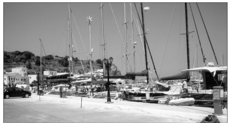
Η νέα παραλία με τα δεκάδες κότερα.

Με απόψεις αντικρουόμενες υποδέχτηκαν οι κάτοικοι των Πάλων τη λειτουργία της «μαρίνας» που έχει δημιουργηθεί στο λιμάνι τους. Η μία πλευρά χαίρεται και επιδοκιμάζει τη νέα μορφή που πήρε η παραλία, και παρακολουθεί με ικανοποίηση τα δεκάδες τουριστικά σκάφη που καθημερινά ελλιμενίζονται, με τους επιβάτες και τα πληρώματα να δίνουν ζωή στο χωριό και οικονομική κίνηση στην τοπική αγορά.