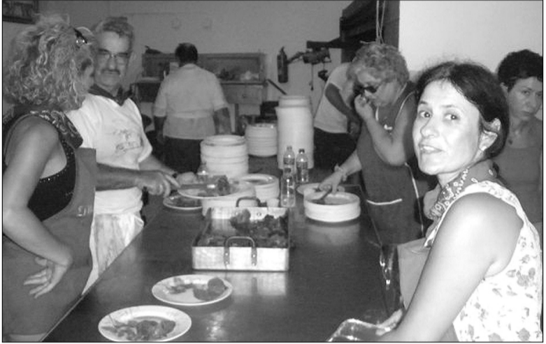
Πρόθυμες οι Νισυριές προσφέρουν τις υπηρεσίες τους στο τραπέζι του πανηγυριού.

Η ίδια Εικόνα και στο πανηγυρικό τραπέζι τόσο την παραμονή στα «ρεβύθια» όσο και ανήμερα, όπου επί 4 ώρες σε συνεχή ροή κατά εκατοντάδες παρακάθιζαν οι πανηγυριώτες για να δεχθούν τις περιποιησεις από τα Νισύρικα νιάτα, που πρόθυμα κι εφέτος έτρεξαν να συμπαρασταθούν και να προσφέρουν τη βοήθειά τους. Κι ακούστηκαν χίλια καλά λόγια τόσο για το έθιμο, όσο και για την ποιότητα των φαγητών, την προθυμία και την ταχύτητα εξυπηρέτησης και κυρίως για την εγκάρδιότητα με την οποία τους αντιμετώπιζαν οι κάτοικοι.