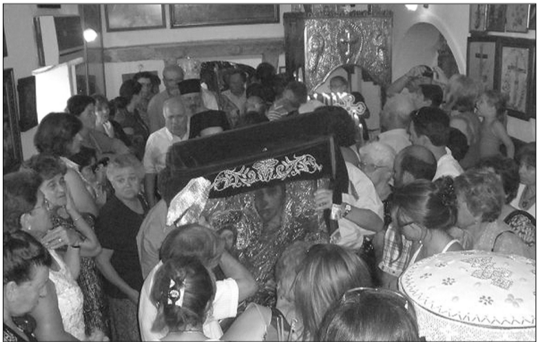
Η λιτάνευση της Εικόνας.

Από ενωρίς την παραμονή και σ' όλο το διήμερο σκορπούσαν ρίγη συγκινήσεως οι χαιρετιστήριοι συριγμοί προς τη Μονή των πλοίων, που μετέφεραν τους προσκυνητές, όπως και τα απαντητικά καλωσορίσματα με πανηγυρικές κωδωνοκρουσίες.