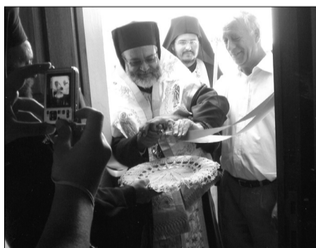
Ο Μητροπολίτης και ο Δήμαρχος κόβουν την κορδέλα.

Ακολούθως εξέφρασε την ικανοποίησή του, γιατί η δημιουργία του Επισκοπείου θα συμβάλει στο να επισκέπτεται συχνά τη Νίσυρο και να επικοινωνεί με το λαό της, τον οποίο συνεχάρη γιατί βρίσκεται σε στενή επαφή με την Εκκλησία. Στη συνέχεια κάλεσε το Δήμαρχο και από κοινού έκοψαν την κορδέλα και μπήκαν στο οίκημα, το οποίο κατεκλύσθη από κόσμο, ο οποίος είχε την ευκαιρία να περιέλθει τις εγκαταστάσεις του.