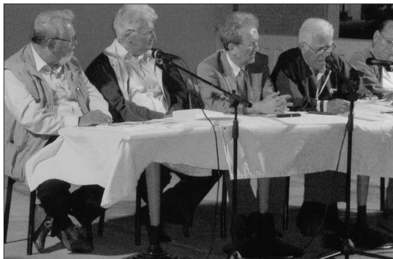
Οι παρουσιαστές του βιβλίου με τον Πρόεδρο της Εταιρείας στο μέσον.

Στο προαύλιο του Δημοτικού Ξενώνα, στη Νίσυρο, έγινε και εφέτος η παρουσίαση του 18ου τόμου «ΝΙΣΥΡΙΑΚΑ», που εκδίδει η Εταιρεία Νισυριακών Μελετών στην Αθήνα.