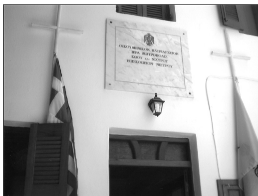
Το κτήριο του Επισκοπείου.