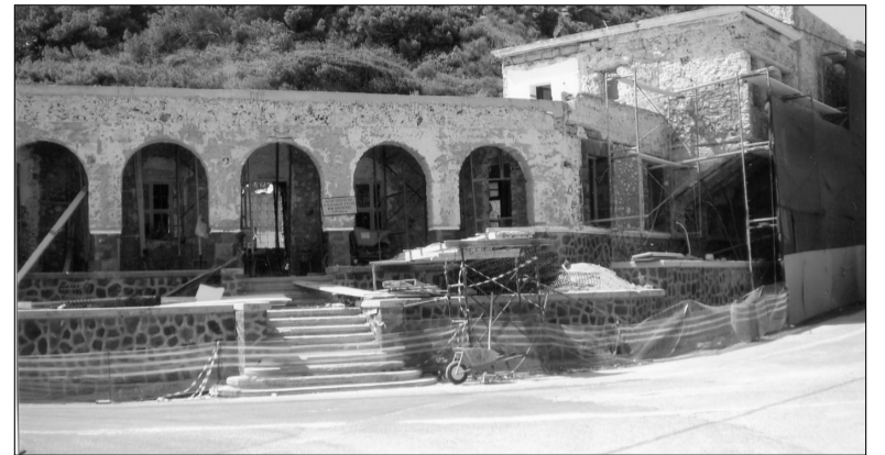
Το κτήριο της Καζάρμας αναστηλώνεται και εκσυγχρονίζεται.

Το κτήριο έχει απογυμνωθεί από σοφάδες, σίδερα, κουφώματα και ό,τι άλλο σάπιο έκρυβε μέσα του και το κουφάρι στο οποίο έχει μεταβληθεί, φανερώθηκε η σοβαρότητα της κατάστασης, στην οποία είχε περιέλθει, ενώ εύκολα μπορεί κανείς να φανταστεί ποιά θα ήταν η περαιτέρω εξέλιξη, εφ' όσον δεν επισπεύδετο η επισκευή του. Κι εδώ ακριβώς βρίσκεται η ουσία και η σπουδαιότητα της παρέμβασης τού τώως