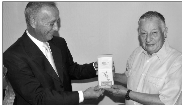
Ο Δήμαρχος Νικ. Καρακωνσταντίνος επιδίδει στον κ. Βαρβιτσιώτη το «χρυσό κλειδί του νησιού».

Σε ειδική εκδήλωση, που έλαβε χώρα στην ανακαινισμένη αίθουσα του «Ζωσιμοπούλειου», ο Δήμος Νισύρου ανεκήρυξε επίτιμο δημότη του τον πρώην Υπουργό και Ευρωβουλευτή Γιάννη Βαρβιτσιώτη. Η ανακήρυξη έγινε εις αναγνώριση της αγάπης του προς τη Νίσυρο, της οποίας είναι τακτικός επισκέπτης, και του ενδιαφέροντος που επέδειξε για τη συντήρηση του κτηρίου του Διοικητηρίου, εξασφαλίζοντας τις αναγκαίες πιστώσεις για τις εκτεταμένες εργασίες που ήδη εκτελούνται σ' αυτό.