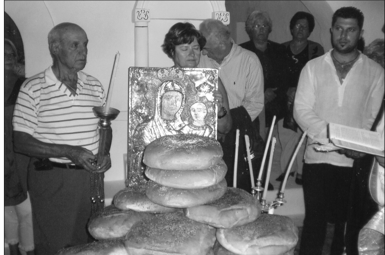
Από τη λιτάνευση της Εικόνας στον πρόναο της Μονής.

Μπορεί να άδειασε ο Εμπορειός. Μπορεί οι Μποριάτες, ακολουθώντας την κοινή μοίρα των άλλων Νισυρίων, να βρέθηκαν στα πέρα της Γης αναζητώντας μια καλύτερη ζωή. Όμως όπου και αν βρέθηκαν, ποτέ δεν έπαψαν να θυμούνται την «Κυρά» και τα πανηγύρια των νεανικών τους χρόνων. Γι' αυτό και φροντίζουν, όσοι μπορούν, να βρίσκονται στο πανηγύρι της και ν' ανάβουν ένα κερί στη Χάρη της. Έτσι κι εφέτος, κι ανήμερα της γιορτής και στα νιάμερα, έφτασαν προσκυνητές και από την Ελλάδα και από το εξωτερικό και απόθεσαν μπρος στην Εικόνα της μαζί με το τάμα τους και τις προσευχές τους για όσους την ώρα εκείνη ζούσαν στα ξένα με νοσταλγία και με τη σκέψη στραμμένη στο χωριό τους και στο πανηγύρι της Μεγαλόχαρης.