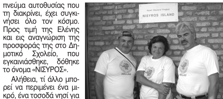
Τρεις Νισύριοι ανθρωπιστές στην καρδιά της Αφρικής

πνεύμα αυτοθυσίας που τη διακρίνει, έχει συγκινήσει όλο τον κόσμο. Προς τιμή της Ελένης και εις αναγνώριση της προσφοράς της στο Δημοτικό Σχολείο, που εγκαινιάστηκε, δόθηκε το όνομα «ΝΙΣΥΡΟΣ».