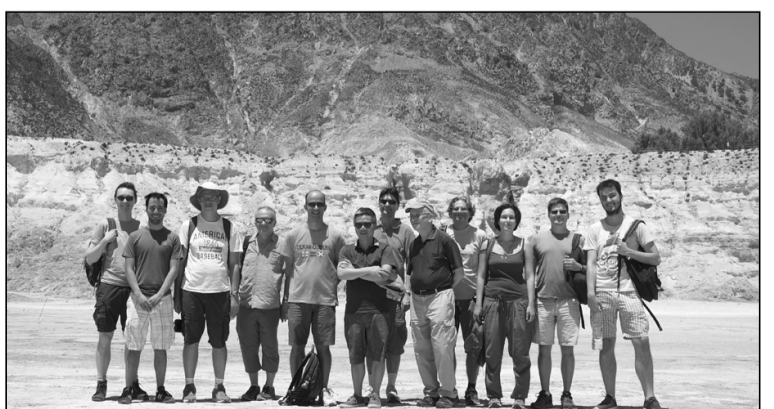
Οι Σύνοδοι στο Ηφαίστειο

Εκτός από τους διοργανωτές, παραβρέθηκαν και έδωσαν διάλεξη άλλοι δώδεκα ερευνητές από τη Γαλλία, την Αγγλία, το Ισραήλ και τις ΗΠΑ και παρακολούθησαν φοιτητές από το ΕΜΠ και το Πανεπιστήμιο Αθηνών. Το συνέδριο έλαβε χώρα στο φιλόξενο χώρο του Γυμνασίου -Λυκείου Νισύρου και στον ελεύθερο χρόνο οι επισκέπτες περιηγήθηκαν στις παραλίες, τα χωριά, το ηφαιστείο και τα μονοπάτια της Νισύρου, από τα οποία έμειναν κατά γενική ομολογία ενθουσιασμένοι.