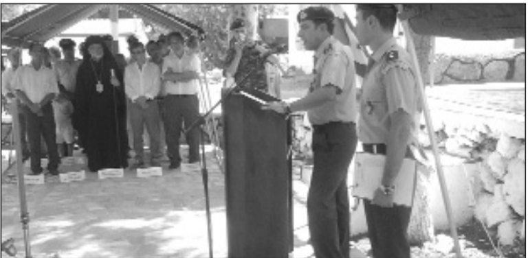
Ο Ταξίαρχος απευθύνει χαιρετισμό

Η μετονομασία, που έγινε μετά από απόφαση του ΓΕΣ, έλαβε χώρα σε μια σεμνή τελετή, που οργάνωσε η διοίκηση του στρατοπέδου και στην οποία παραβρέθηκαν, ο Μητροπολίτης Κώου και Νισύρου Ναθαναήλ, συνοδευόμενος από τον Αρχιερατικό Επίτροπο Αρχιμ. Στέφανο, ο Διοι-