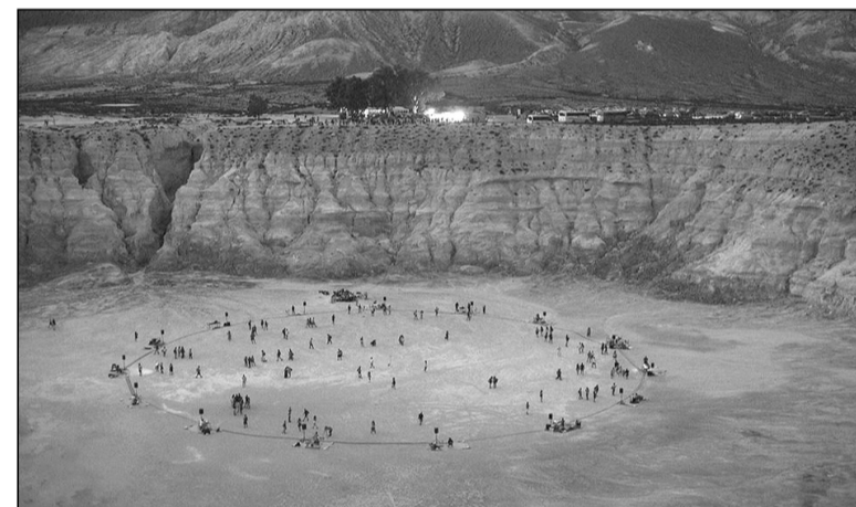
Οι μουσικοί στον κρατήρα

Μια πρωτόγνωρη, στα παγκόσμια μουσικά δρώμενα, εκδήλωση έλαβε χώρα μέσα στον κρατήρα του ηφαιστείου της Νισύρου, που πέρα από την υψηλού επιπέδου ψυχαγωγία, που προσέφερε στις χιλιάδες του κόσμου, που έσπευσαν και από τα γύρω νησιά να δώσουν το παρών, συνέβαλε στο να αποκτήσει η Νίσυρος μια τεράστια προβολή παγκοσμίως.