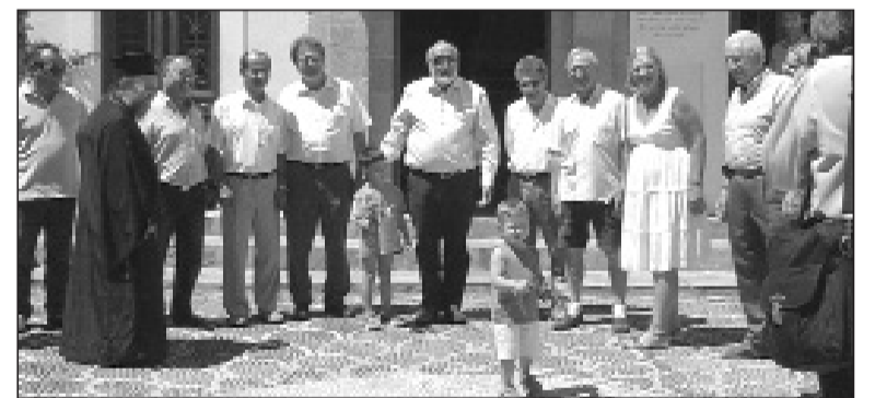
Ο Υπουργός αναχωρεί από το Δημαρχείο

Για το θέμα της κυριότητας της νησίδας Γυαλί, ζήτησε να του υποβληθούν πληρέστερα στοιχεία, υποσχόμενος ότι, παρά το γεγονός ότι δεν εμπήκει στη δική του αρμοδιότητα, θα ασκήσει πίεση προς τους αρμόδιους συναδέλφους του.