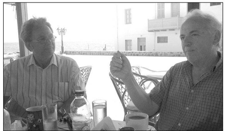
Η ώρα της συμφωνίας