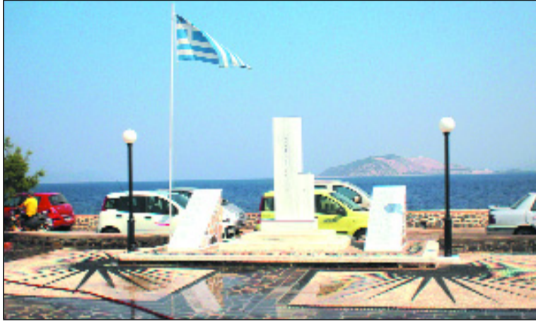
Το Ηρώο των Πεσόντων με τις δύο πλάκες.

Μ ε σεβασμό η Νίσυρος υποκλήθηκε σε μια ηρωική πράξη ομάδας παιδιών της, τα οποία αφηφώντας τον κίνδυνο, ό-κμα και το θάνατο, έσπευσαν να βοηθήσουν την Πατρίδα, ό-ταν κάποτε είχαν απειληθεί η λευτεριά και η ακεραιότητά της.