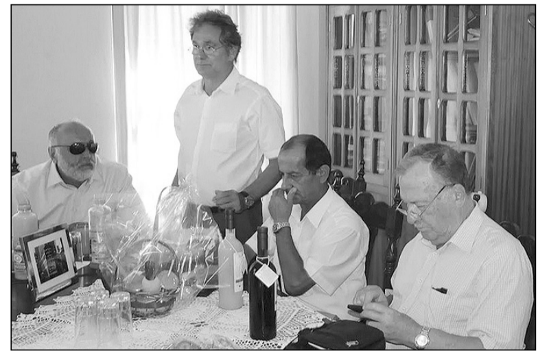
Από τη σύσκεψη στο Δήμο

«Ο Δήμος Νισυρίων, όπως και οι λοιποί Δήμοι της Χώρας, είναι υποχρεωμένος να ακολουθήσει μια σειρά από διαδικασίες, οι οποίες προϋποθέτουν και την ύπαρξη εκπαιδευμένου και με ανάλογα προσόντα προσωπικού. Όμως δεν διαθέτει ούτε νομική, ούτε τεχνική υπηρεσία, ενώ έχει υποστελεχομένη οικονομική υπηρεσία, όπως υποστελεχομένες είναι και οι διοικητικές υπηρεσίες του. Μ' αυτές τις συνθήκες είναι αδύνατο να γίνει απορρόφηση των κονδυλίων ΕΣΠΑ και μάλιστα με αυτό τον χρονοβόρο και άχρηστο,