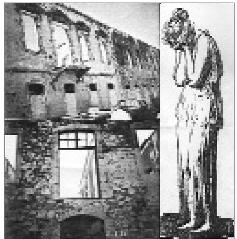
Η Μάνα Νισύρος κλαίουσα για την κατάντια των Λουτρών της.

Κανένας δεν παραβλέπει τη δυσκολία και τη σοβαρότητα του έργου της αναστήλωσης του κτηριακού συγκροτήματος των Λουτρών, ούτε και αμφισβητεί