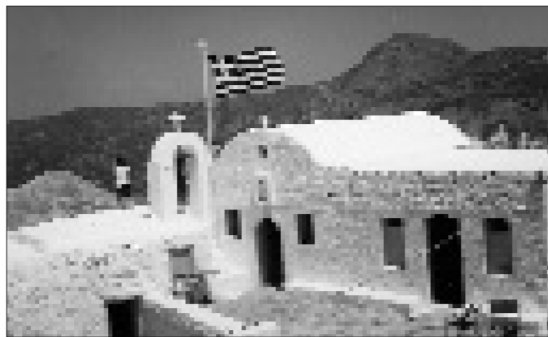
Το μοναστήρι του Σταυρού στο Άργος.

Με την καθιερωμένη ατμόσφαιρα κεφιού και χαράς και με τη συμμετοχή προσκυνητών απ' όλο το νησί, τελέστηκαν κι εφέτος τα δύο μεγάλα πανηγύρια, του Σταυρού στο Άργος και του Αγίου Θεολόγου στα Νικιά.