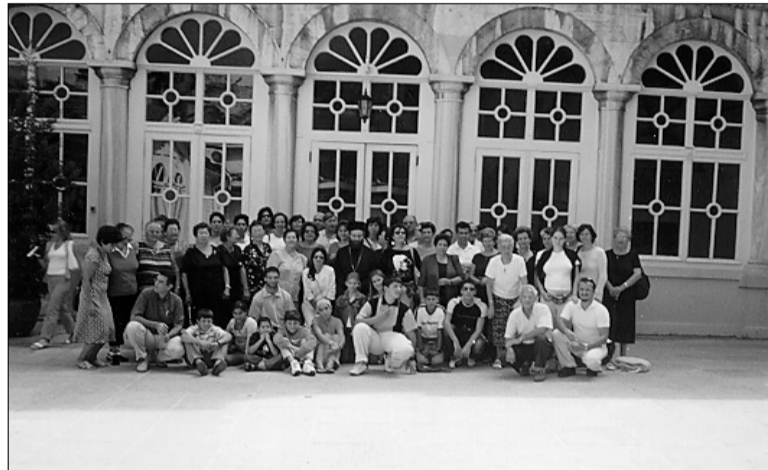
Οι εκδρομείς στην είσοδο του Πατριαρχικού Ναού του Αγίου Γεωργίου