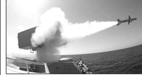
Εκτόξευση βλήματος από πυραυλάκατο

Το μόνο που γίνεται φανερό, είναι η αυθαίρετη επιδίωξη της για αναθεώρηση, κατά το δοκούν και προς ίδιον όφελος, διεθνών συμφωνιών, ενέργεια που συνεπάγεται την ανατροπή της σύγχρονης παγκόσμιας ιστορίας, του περί δικαίου αισθήματος και του ίδιου του Διεθνούς Δικαίου. Παρ' όλα αυτά η Τουρκία επιμένει στις διεκδικήσεις της, καλυπτόμενη πίσω από τα συμφέροντα μεγάλων και ισχυρών παραγόντων, των ίδιων, που, κατά τα άλλα, παρουσιάζονται λεκτικά ως υποστηρικτές των δικαιών της Ελλάδος.