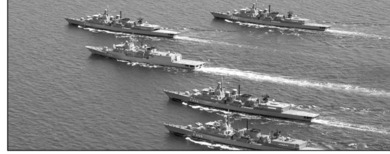
Οι φρεγάτες μας σε πλήρη σχηματισμό «θαλάσσιο τείχος» στο Αιγαίο

Τον καλύτερο διαφημιστή τους βρήκαν οι Τουρκικές Ένοπλες Δυνάμεις στα κανάλια κάποιων Ελληνικών τηλεοπτικών σταθμών, στη διάρκεια της πρόσφατης Ελληνοτουρκικής διαμάχης στην Ανατολική Μεσόγειο. Γέμιζαν σε κάθε ευκαιρία οι οθόνες τους, με τις τουρκικές πολεμικές αρμάδες να πλέουν σε πολεμικούς σχηματισμούς, πολυάριθμες, πάνοπλες και ...θεόρατες, όπως τις παρουσίαζε ο ζουμαρισμένος προπαγανδιστικός φακός των γεγόνων μας, με την ημισέλινο να καλύπτει τον Μεσογειακό ουρανό και να προειδοποιούν για τις εθιμικές προθέσεις τους, περιστρέφοντας τους πύργους των επανδρωμένων πυροβόλων, με τις κάννες στραμμένες προς στόχους Ελληνικούς. Αν κάποτε περίσσευε χώρος, φαινόταν κάπου στο βάθος και κάποιες μονάδες του Στόλου μας, να πλέουν μεμονωμένα ή σε ζεύγη, σαν ... φτωχός συγγενής. Εφιάλης στους ... απέναντι, είχαν γίνει οι Ελληνικές Φρεγάτες, ανατρέποντας το ένα μετά το άλλο τα επιχειρησιακά τους σχέδια.